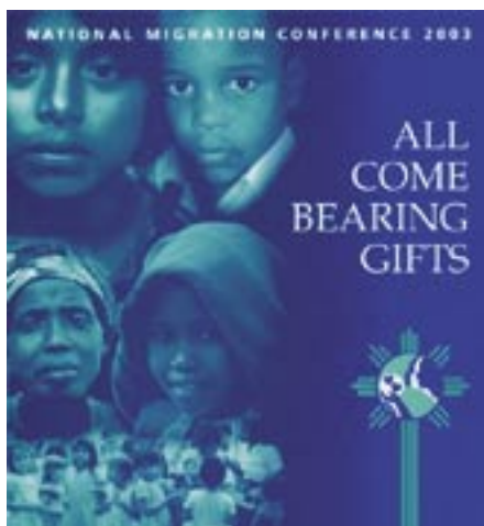
Cover of the National Migration Conf. Program July 6-10, 2003